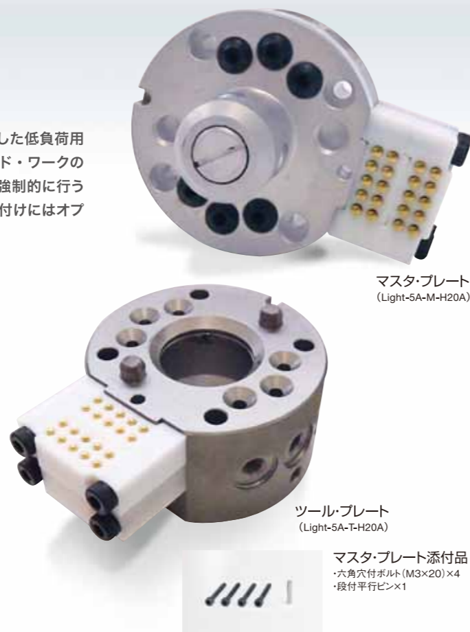
マスタ・プレート (Light-5A-M-H20A)

着用空気圧の供給が停止しても、マスタ・プレートとツール・プレートが分離しないよう、当社独自の着脱機構部により、メカニカル・フェールセーフ機構を採用。